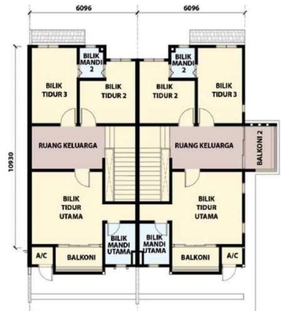
Pelan Aras Satu